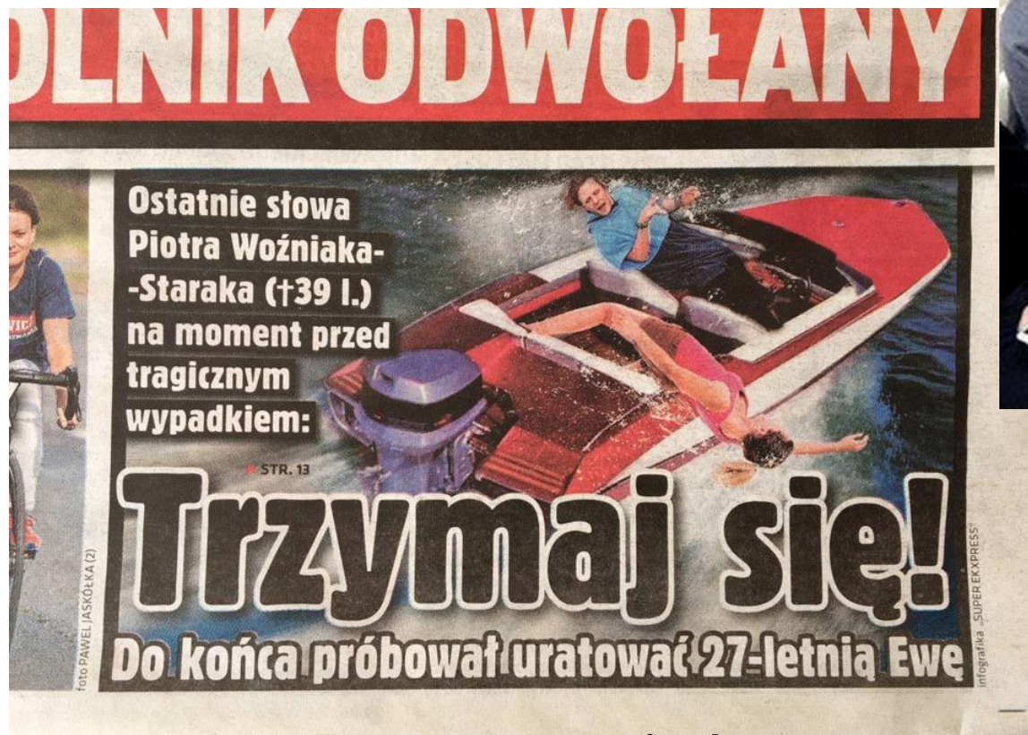
Fotomontaż do gazety